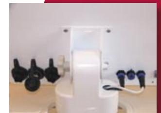
Conexión trasera IP 68