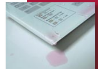
Teclado en vidrio templado liso