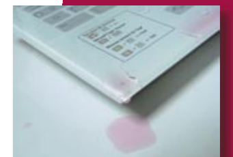
Clavier verre trempé étanche