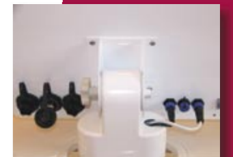
Connexions arrière IP 68