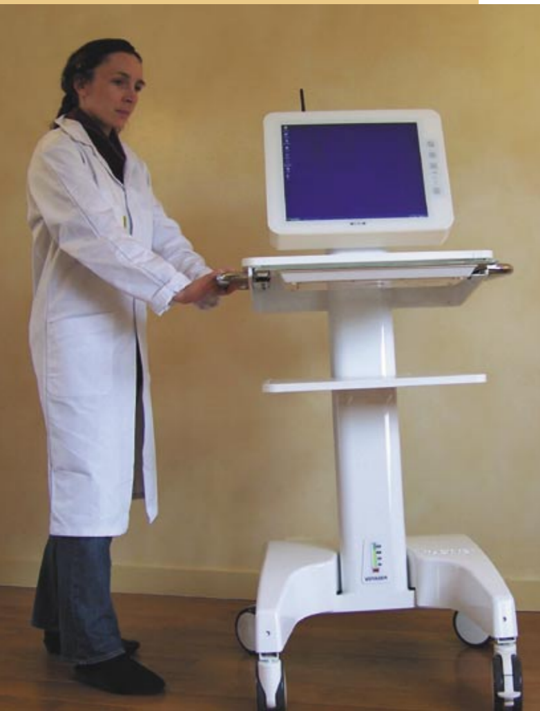
Plus qu'un chariot : votre robot-Voyager

Immédiatement opérationnel, VOYAGER contient un équipement informatique et électronique complet et innovant.